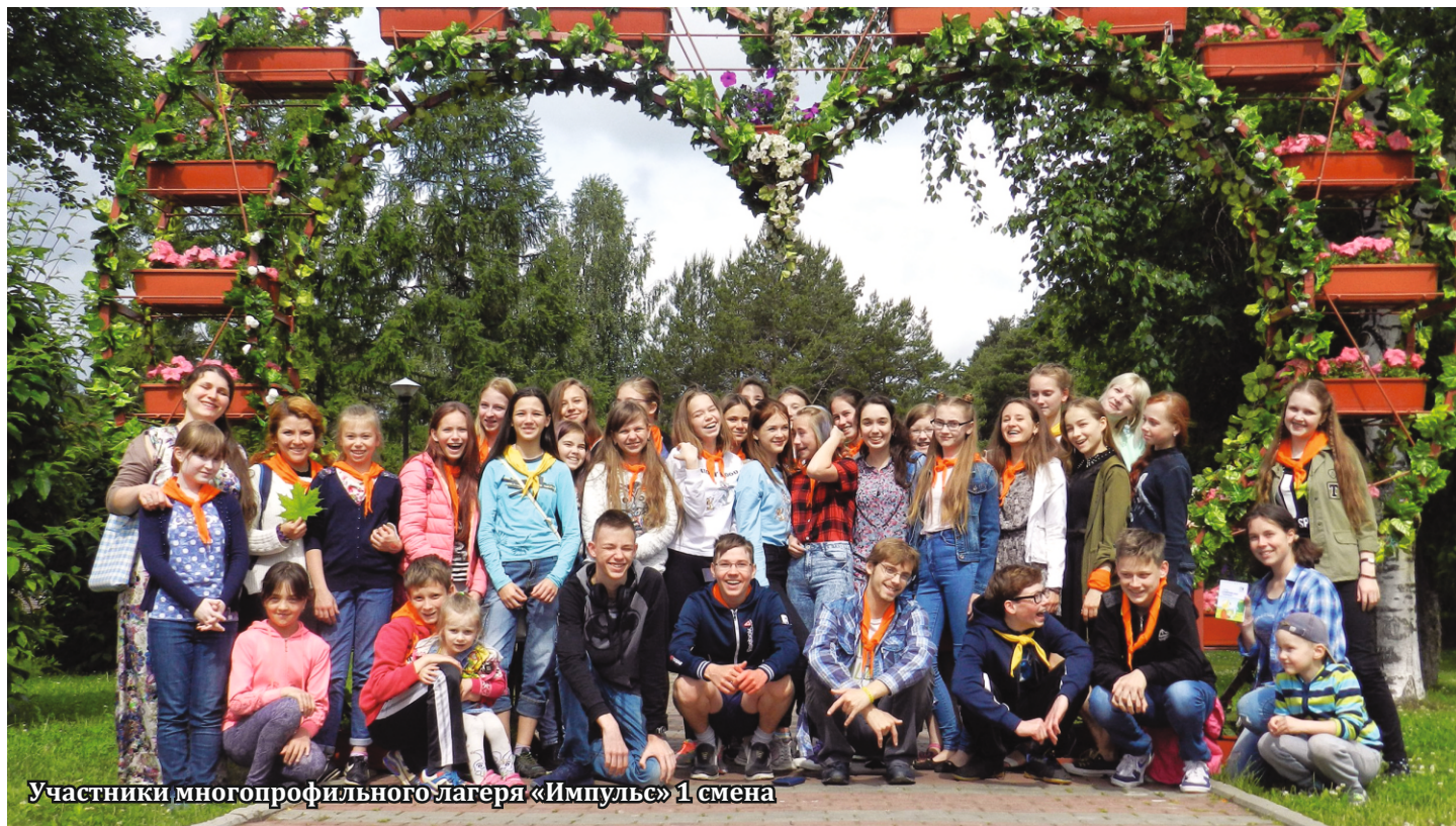
Участники многопрофильного лагеря «Импульс» 1 смена